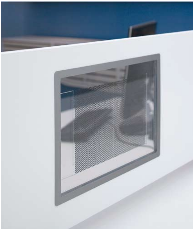
Her ses ”den transparente skærm” integreret i et Montana bord.

Der er basis for en first-mover-advantage på verdensplan, som kan skabe nye arbejdspladser samt nyt ry om dansk miljøteknologi og eksport